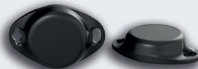
Bluetooth Transponder (einweg)