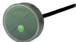
grün: Tag gelesen