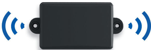
Bluetooth Transponder Robust (wasserdicht)