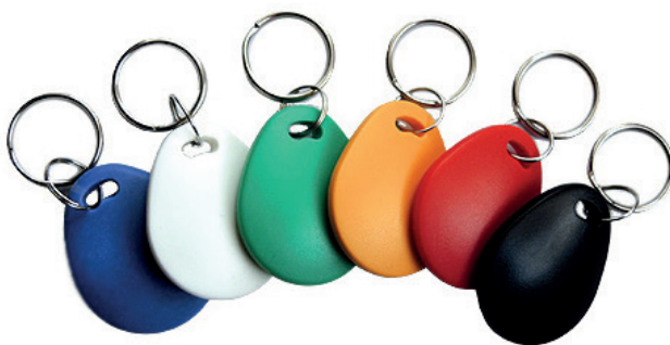
NFC/RFID-Tags als Schlüsselanhänger